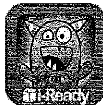
World's Worst Pet