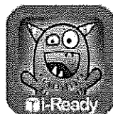
World's Worst Pet