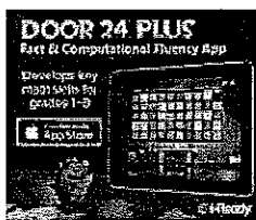
Door 24 Plus

For extra math and vocabulary practice, try our FREE Apps, available from the iTunes store.