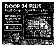
Door 24 Plus

Para más práctica de matemáticas y vocabulario, prueba nuestras aplicaciones GRATIS, disponibles en la tienda de iTunes.